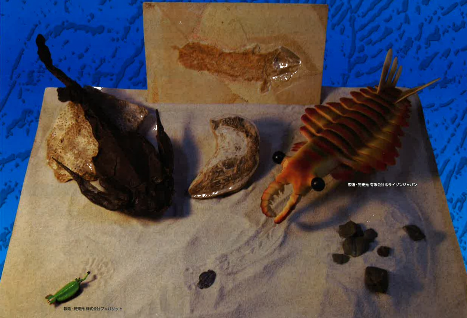
製造・発売元 有限会社ホライゾンジャパン

本展示事業は一般財団法人全国科学博物館振興財団の 全国科学博物館活動等助成事業の助成を受けて実施されます。