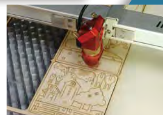
加工(試作)サンプル